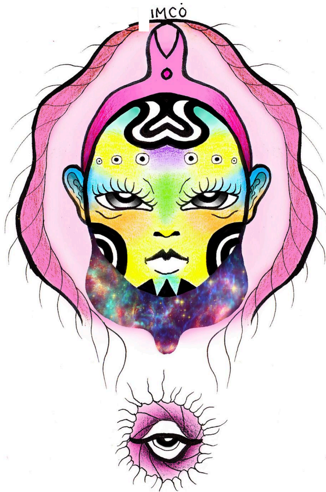
Artwork by Kim Cỏ.